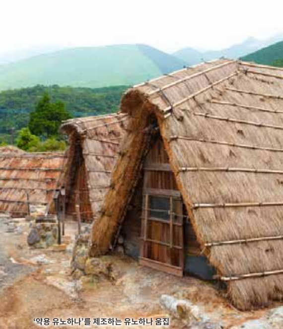
'약용 유노하나'를 제조하는 유노하나 움집