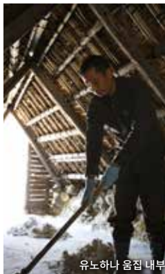
유노하나 움집 내부